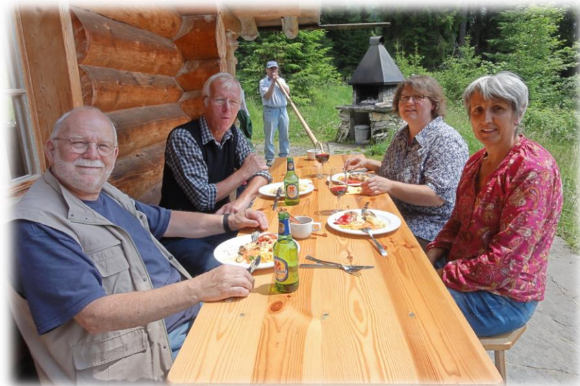
OK Seniorenmittagstisch

Über neue Gesichter freuen wir uns sehr!