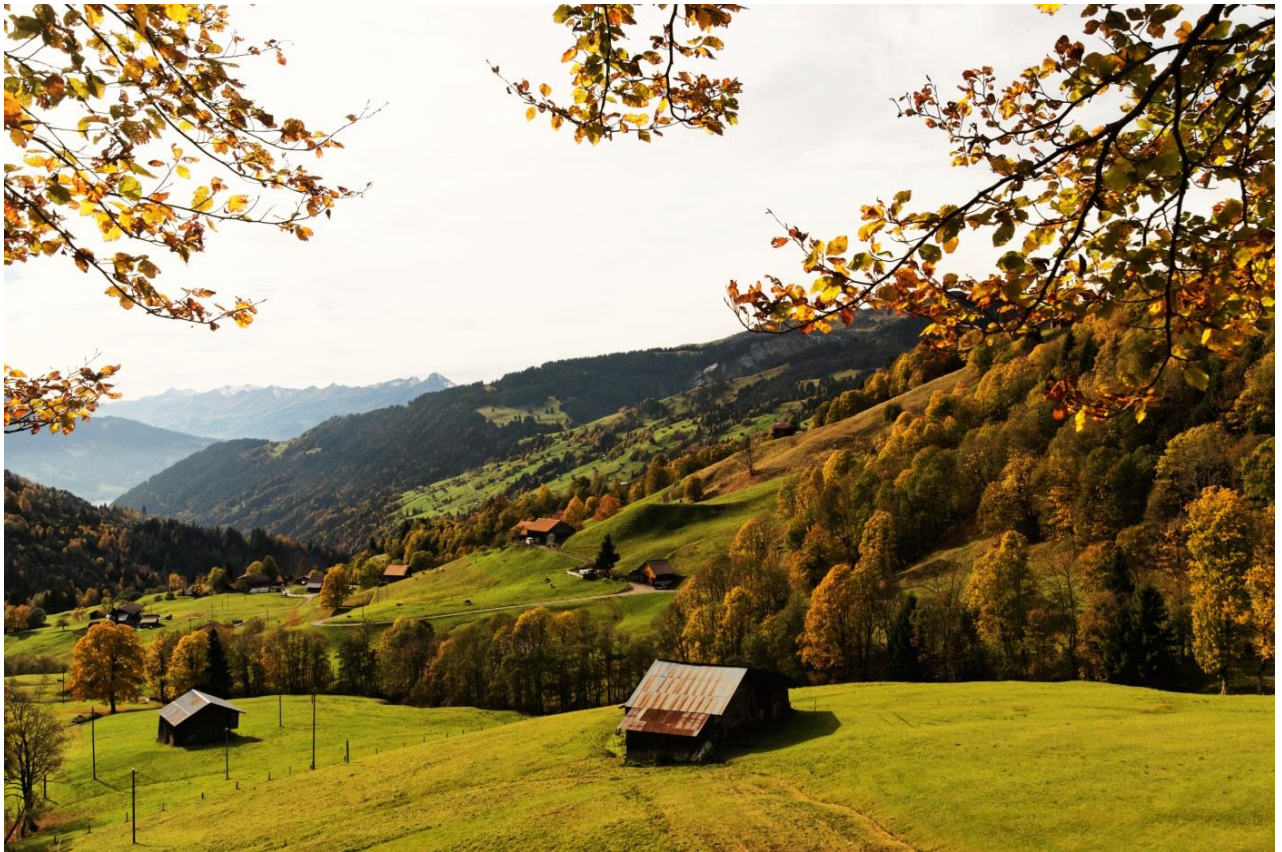
Habkern im Herbst